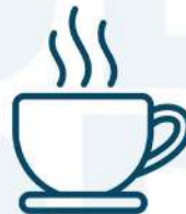
Зал для кава-брейків