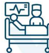
Можливість трансляції з операційної